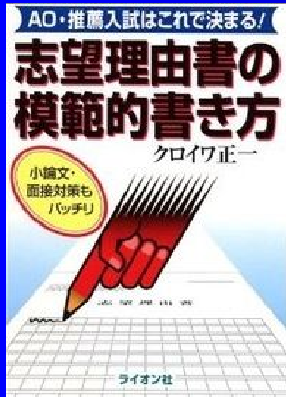
『志望理由書の 模範的書き方』 (ライオン社)