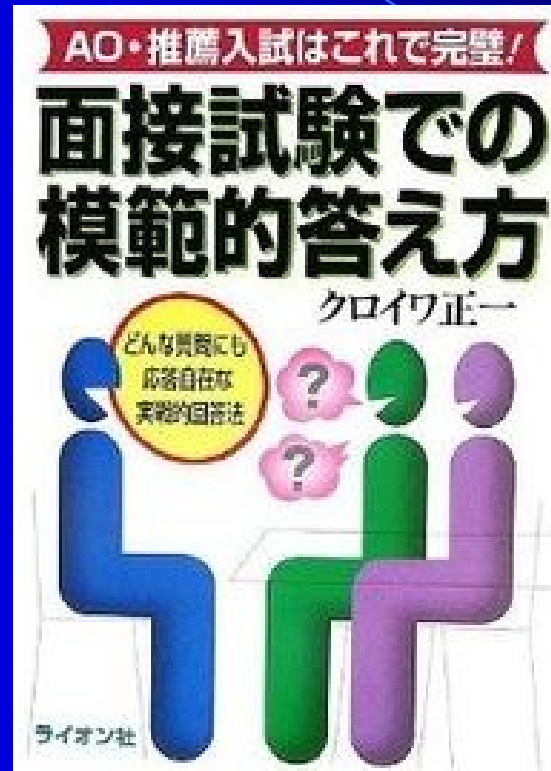
『面接試験での 模範的答え方』 (ライオン社)