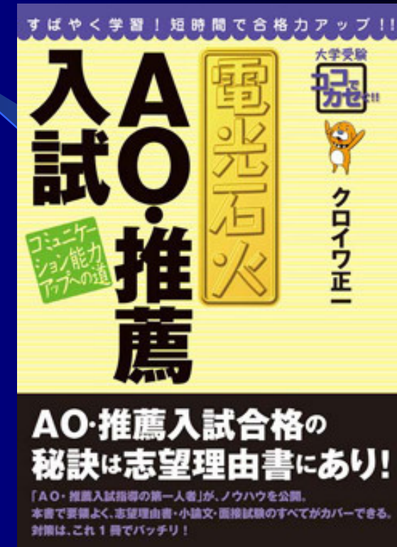
『電光石火 AO・推薦入試』 (ブックマン社)